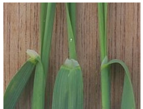
Detalle de la lígula